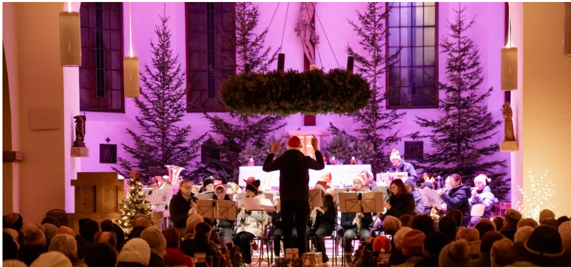
Abb: Kirchenkonzert Young Christmas am 08.12.2023

Liebe Freunde und Unterstützer der Trachtenkapelle Puchberg,