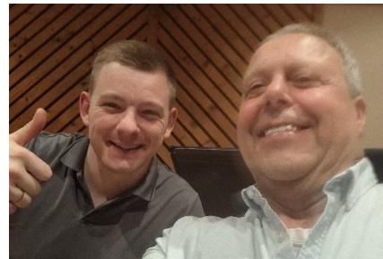
Ein Foto für Carmen von Stephan und Gerhard 😊