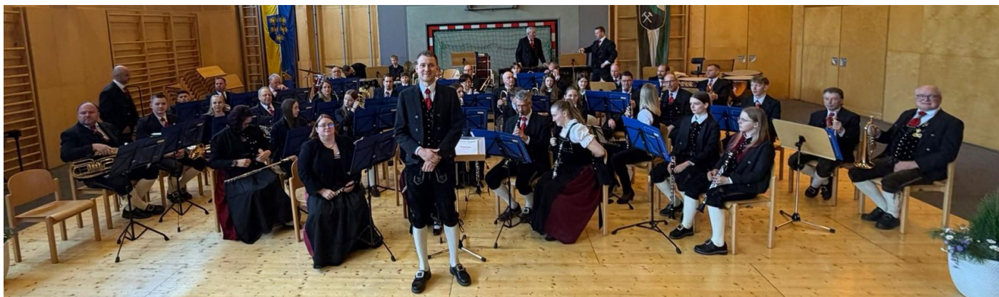
Vor dem Spiel in der Barbarahalle in Grünbach.