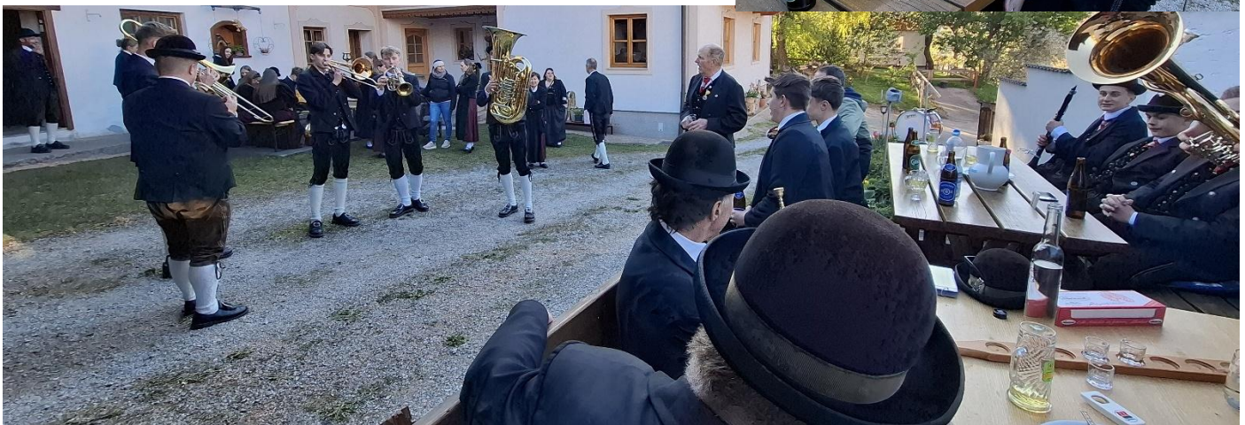
Beim „Fisch“ Gh Alber